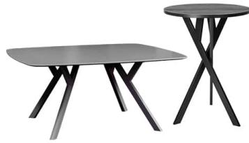
Felber T14 Tisch