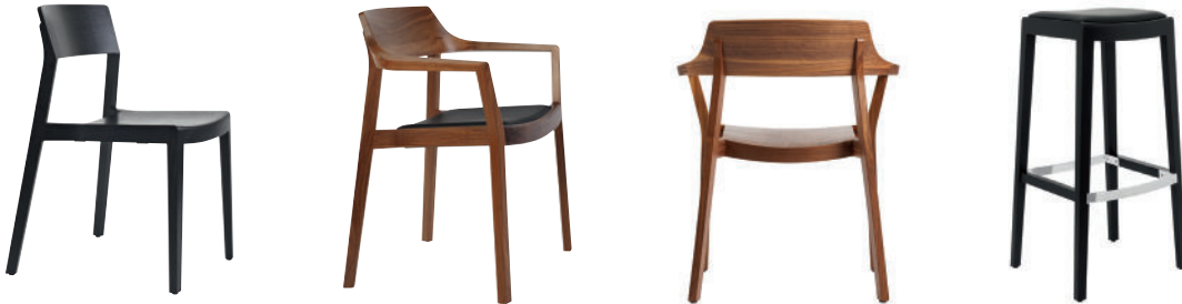
Stuhl - Barstuhl