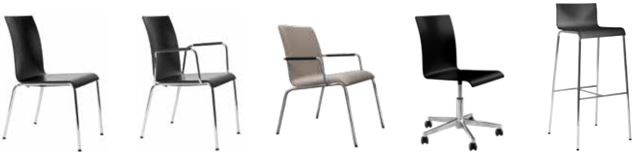
Stuhl · Lounge · Drehstuhl · Barstuhl