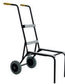
Chariot de transport "Multi"