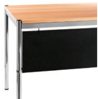
Connexion table à table