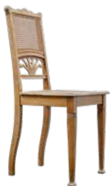
Chaise en bois Dietiker de 1909