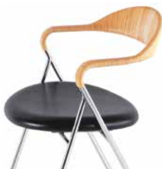
1958 Chaise Saffa de Hans Eichenberger