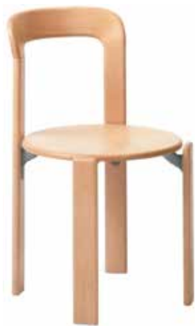
1971 Modell Rey33 conçu par Bruno Rey

C'est la première chaise «sans vis» avec console en aluminium brevetée. Aujourd'hui encore, c'est la chaise la plus vendue de l'histoire de Dietiker et probablement la plus performante du marché suisse du meuble. Siège en contreplaqué et dossier en bois courbé. Une console en aluminium moulé sous pression relie les pieds au siège en contreplaqué. À cette fin, des études détaillées sur la formation des points de fixation étaient nécessaires et un adhésif approprié devait être développé.